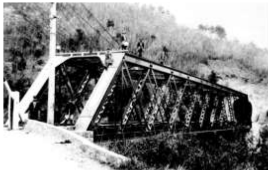
開業当時の早川橋梁