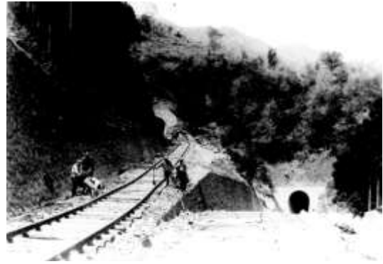
出山信号場付近建設工事