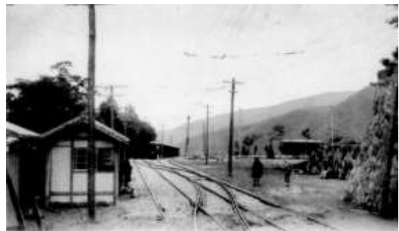
開業当時の登山鉄道（大平台駅）