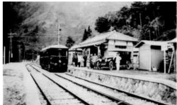
開業当時の登山鉄道（小涌谷駅）