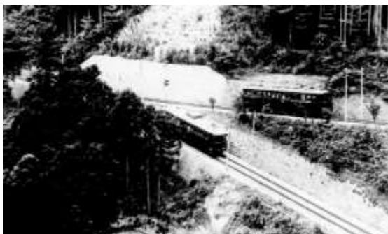
開業当時の登山鉄道（出山信号場付近）