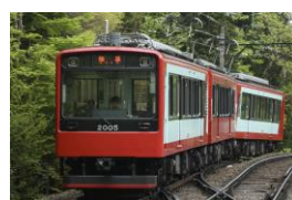
S3 (2005) 氷河特急塗装 [2009年～]

※印の車両は、本年度塗装変更を実施する車両。109号車については、4月17日よりこの塗装で運行中。106号車については、6月11日より写真のカラーで運行を予定しております。