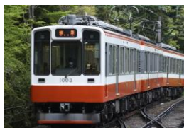
B2 (1003) 1000形登場時塗装 [1981年～89年頃] [2008年～12年][2016年～]