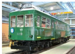
※109 100形緑塗装 [1935年～49年頃] [2019年4月～]