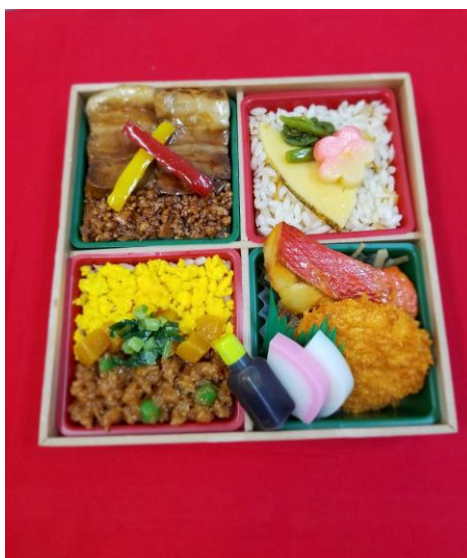
100周年記念弁当(イメージ)