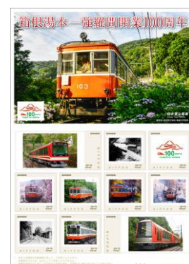
100周年記念切手(イメージ)