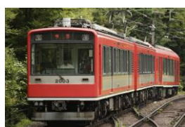
S2 (2003) アレグラ号塗装 [2014年～]