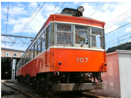
引退するモハ1形（103－107編成）