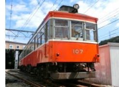
107 100形標準塗装 [1957年～]