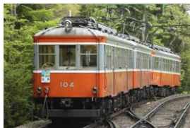
104 100形標準塗装 [1957年～]

現在も様々な特別塗装列車を運転しておりますが、当キャンペーンに合わせて箱根登山電車100年の変遷を再現した塗装列車を新たに加えて100周年キャンペーンを盛り上げます。