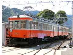
103 100形標準塗装 [1957年～]