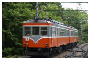
108 100形金太郎塗装 [1957年～不明] [2008年～]