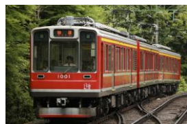
B1 (1001) レーティッシュ鉄道塗装 [1999年～]