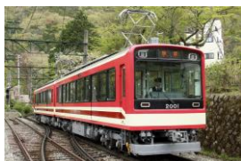
S1 (2001) 2000形登場時塗装 [1989年～99年頃] [2018年～]