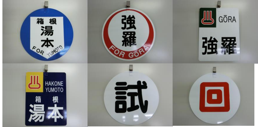
復刻方向板（イメージ）