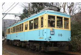
※106 100形青塗装 [1949年～57年頃] [2019年6月～]