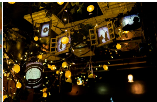
現在好評開催中の「箱根湯本SUMMER NIGHT VILLAGE～29番地Bar&Grill～」の様子