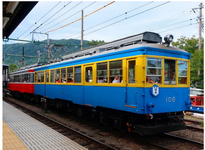
今般ライトアップされる「100形青塗装」