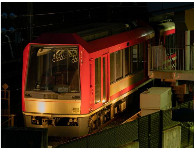
「登山電車100番地」ライトアップの様子 (写真は3100形アレグラ号)

※車両運用の都合や悪天候等で、車型の変更またはライトアップが中止になる場合があります。