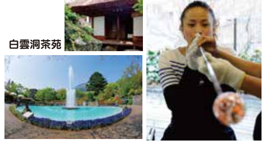
★箱根強羅公園は、当券で無料で入園いただけます。

四季を通じて季節の花が楽しめる大正3年に開園した歴史ある公園。園内には箱根クラフトハウスや茶室がある他、ランチや休憩ができるカフェもありゆっくりと楽しめます。