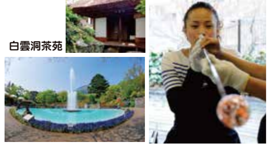
★箱根強羅公園は、当券で無料で入園いただけます。

四季を通じて季節の花が楽しめる大正3年に開園した歴史ある公園。園内には箱根クラフトハウスや茶室がある他、ランチや休憩ができるカフェもありゆっくりと楽しめます。