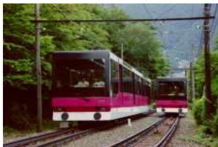
（箱根登山ケーブルカー）