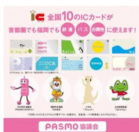
ポケットティッシュのデザイン