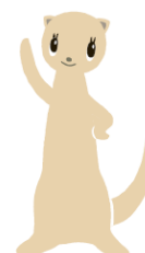
ニモカ 「フェレット」