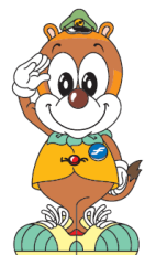
福岡市交通局 「ちかまる」